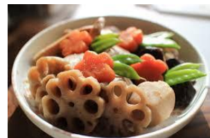
煮物は素材の味がしっかり出ます