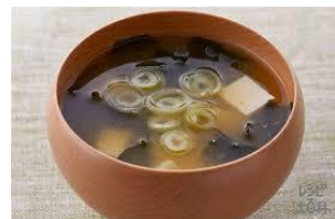
出汁の味がぎゅっと出ます