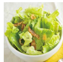
生野菜はシャッキ