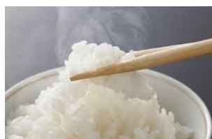
ご飯がふっくら炊けます