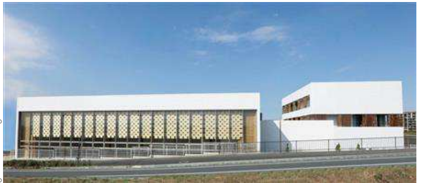
大型木造建築物ポラス建築技術訓練校

ポラスグループは木造非住宅事業の推進と拡充を図り、昨年非住宅中大規模木造建築物「建築技術訓練校」を完成させました。3階建ての事務所棟及び実習棟に住宅用プレカット加工機のみで加工した「合せ柱・合せ梁・重ね梁」を用い建築。木造非住宅の割合を拡大していくためのモデルハウス的な存在」として中規模建築の木造化の復旧に力を入れています。