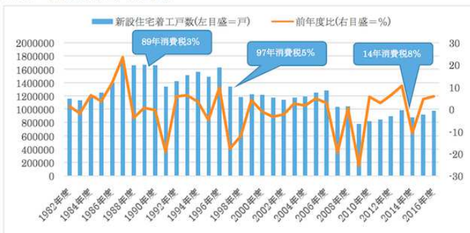
図表1 新設住宅着工戸数の推移