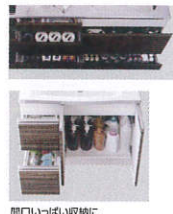
開口いっぱい収納に