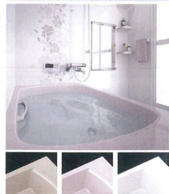
シュガーライトベージュ シュガーライトピンク シュガーホワイト