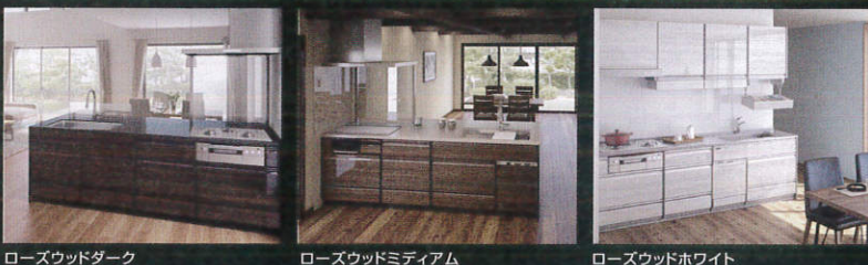
ローズウッドダーク