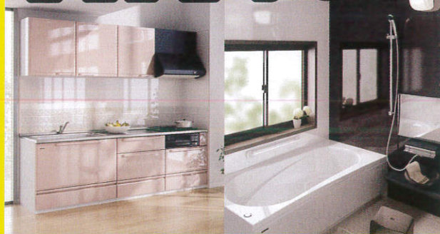
■タカラシステムキッチン「エーデル」 型 間口255cm、足元スライドタイプ