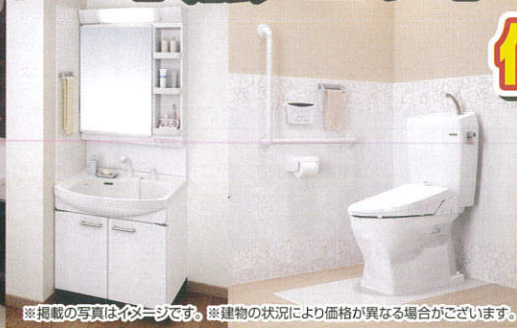
■タカラホーロー洗面化粧台「スーリア」 間口75cm