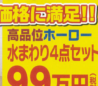
■節水型トイレ「ティモニUシリーズ」 温水洗浄便座タイプ