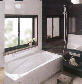
■タカラ耐震システムバス「ミーナ」 1坪サイズ(1616)